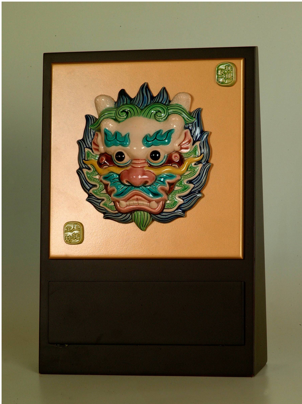
聯賽獎座(純名家手工精緻，以實品為準)