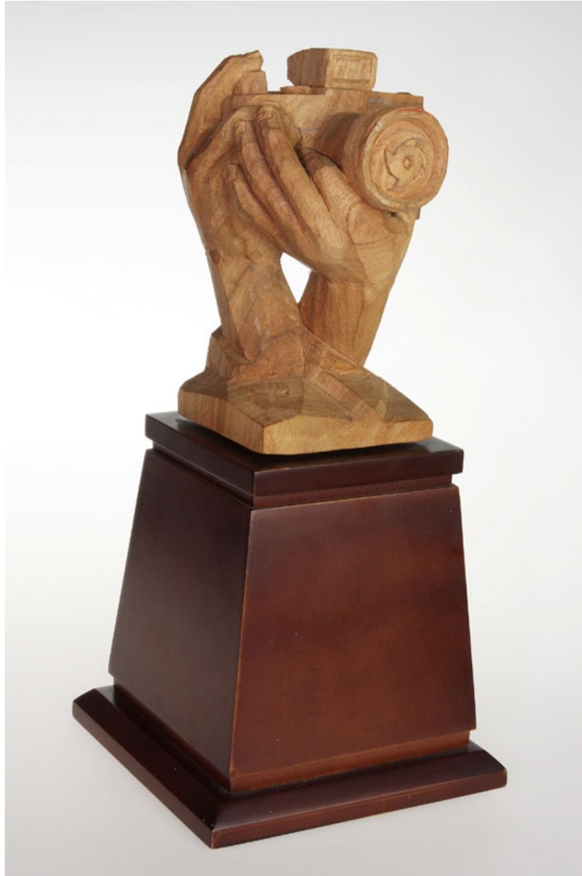
聯展獎座(純名家手工精緻，以實品為準)