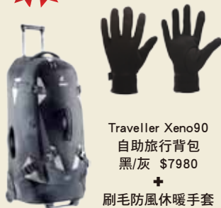
Traveller Xeno90 自助旅行背包 黑/灰 $7980 + 刷毛防風休暖手套 顏色/ 黑$580