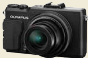
XZ-2大光圈類單眼數位相機 $10980