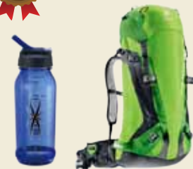
輕量攀登型背包 綠/淺綠 $5280 + 運動型水壺 / 藍色$470